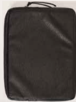
item# 71060 13"