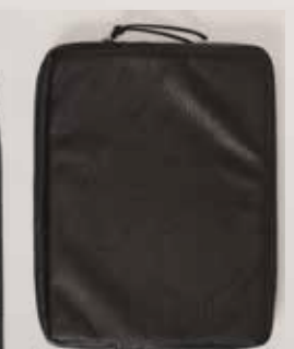
item# 72060 13"